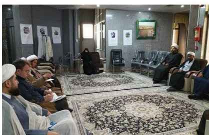
جلسه فصلی هم اندیشی اساتید مرکز تخصصی نماز مشهد