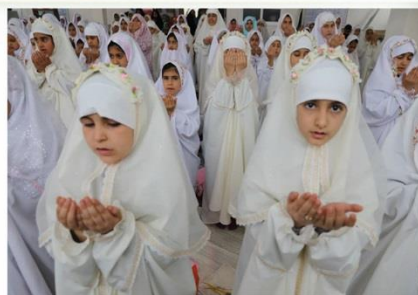
آغاز یک مسیر تازه/ ضیافت جشن تکلیف ۱۶۰ دانش آموز دختر در محله انصار مشهد