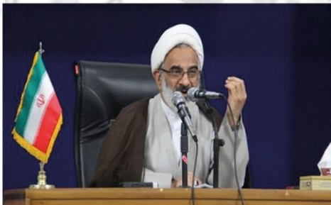
دومین همایش «منزلت نماز» قرارگاه منطقه‌ای ثامن الائمه(ع)