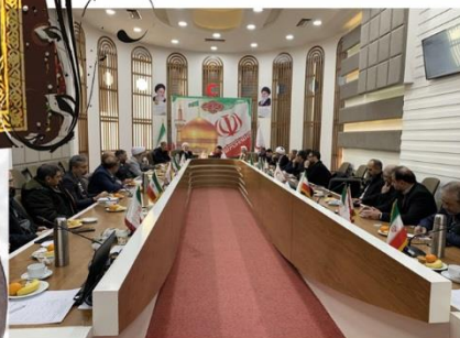
جلسه فصلی دبیران اقامه نماز دستگاه های اجرایی خراسان رضوی