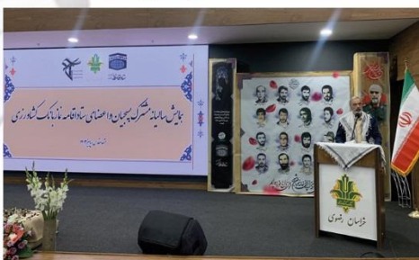
همایش مشترک بسیجیان و دبیران اقامه نماز بانک های کشاورزی با حضور قائم مقام ستاد اقامه نماز