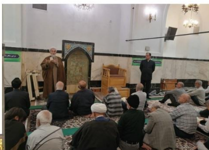
اختصاص رواق تخصصی نماز در حرم مطهر رضوی