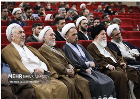
دومین همایش استانی نماز سپاه امام رضا(ع) با شعار نماز، نماد قدرت و عامل تمدن ساز