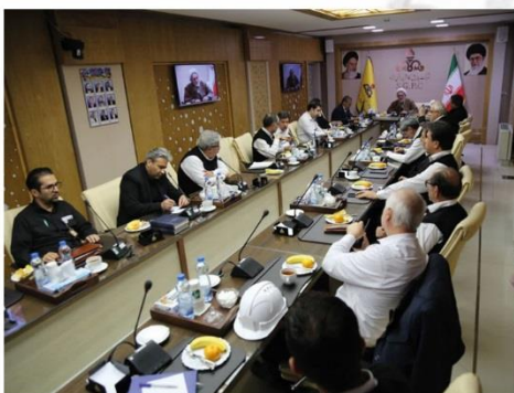
جلسه شورای اقامه نماز پالایشگاه گاز شهید هاشمی نژاد