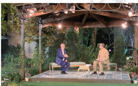
برنامه زنده تلویزیونی «شب شرقی» با حضور قائم مقام ستاد اقامه نماز کشور