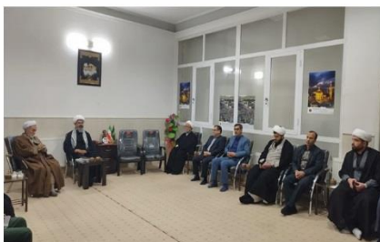
جلسه شورای اقامه نماز شهرستان کاشمر